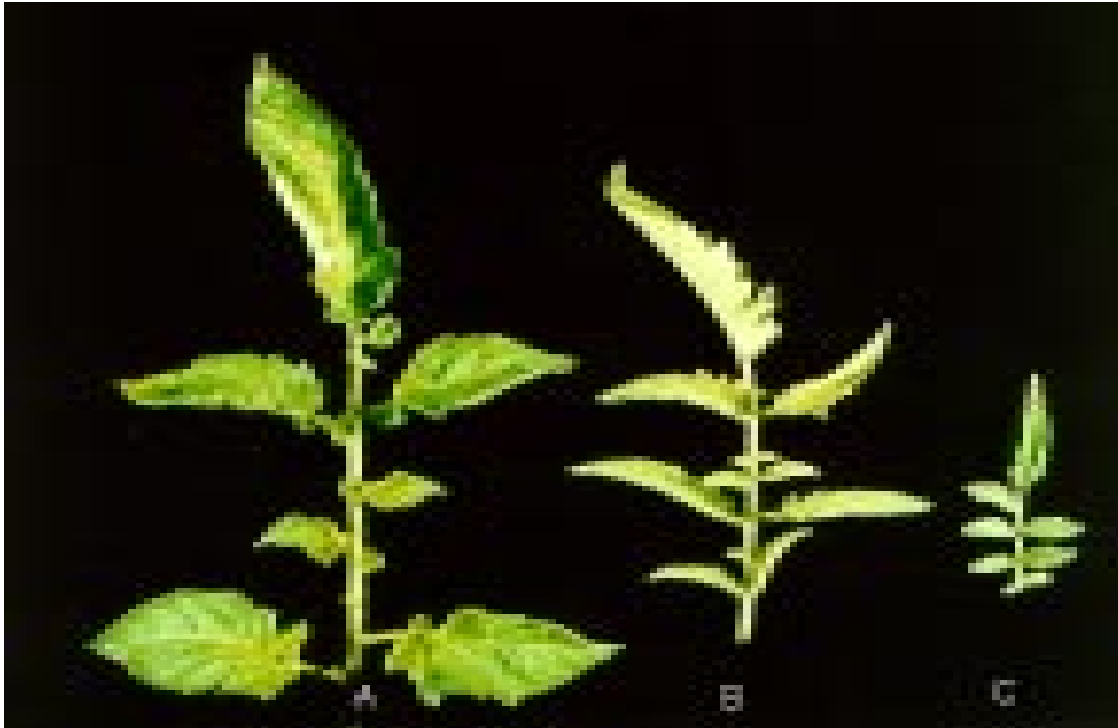
Figura 2. Comparação da morfologia da folha do genitor feminino L. esculentum (A), do híbrido interespecífico (B) e do genitor masculino L. peruvianum (C).