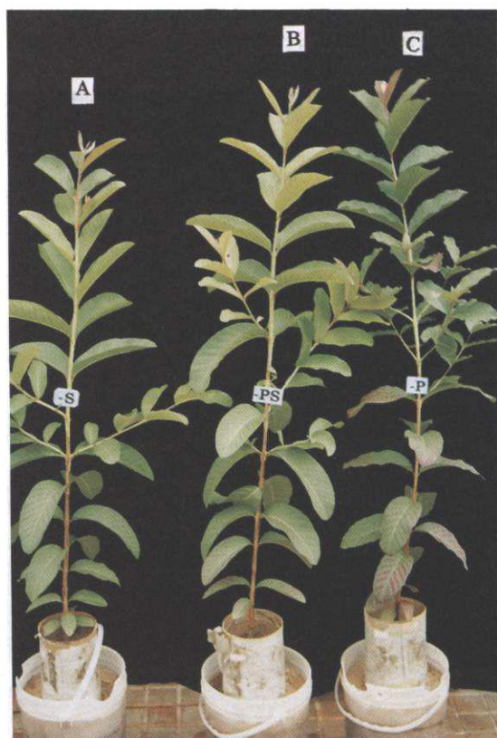
FIG. 4. A - deficiência de enxofre; B - deficiência de fósforo e enxofre; C - deficiência de fósforo.

Os sintomas foliares causados pela falta conjunta de K e S, em ocorrência simultânea, foram, inicialmente, distintos e de localização também distinta, caracterizados pelo comportamento de cada nutriente dentro da planta. A mobilidade dos nutrientes, mencionada por Epstein (1972) e Marschner (1995), explica a manifestação dos sintomas de carência de K, elemento móvel, que surge inicialmente nas folhas mais velhas, enquanto os de S, de baixa redistribuição, aparecem nas partes mais jovens.