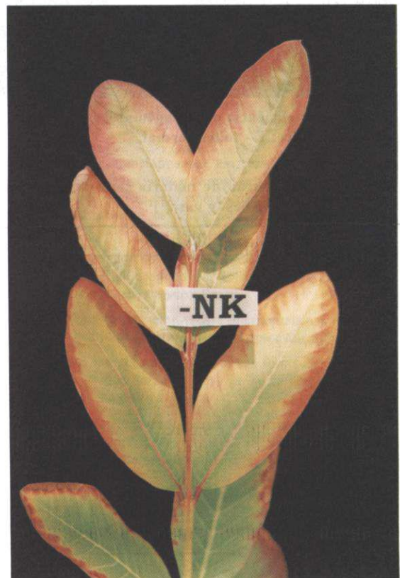
FIG. 2. Efeito da omissão simultânea de nitrogênio e potássio.