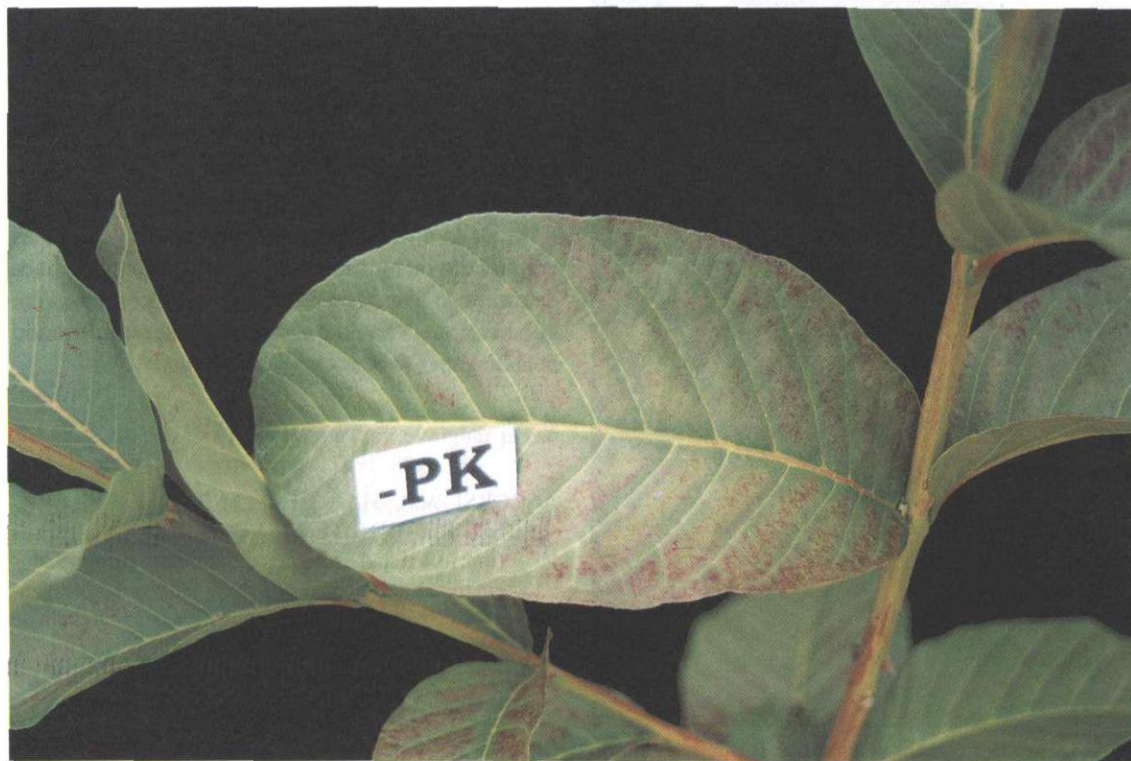
FIG. 3. Folhas com deficiência de fósforo e potássio.

As folhas superiores de plantas carentes em P, conjuntamente com S (-PS), apresentaram-se cloróticas, pequenas, estreitas e côncavas (deficiência de S). As folhas basais exibiam faixas vermelhas internervais em progressão ascendente e gradativa (deficiência de P), até ocorrer a mescla dos sintomas