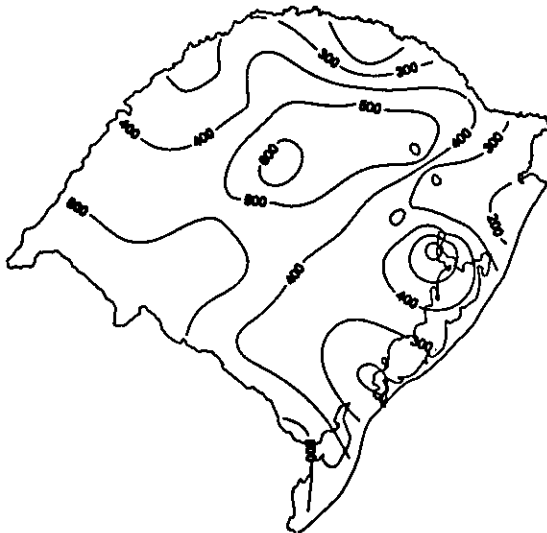
FIG. 2. Deficiências hídricas - balanço hídrico de Thornthwaite & Mather (1957), com 100 mm de capacidade de armazenamento de água disponível no solo - ocorridas no Rio Grande do Sul no período de setembro de 1985 a maio de 1986.

Para analisar a capacidade do índice GVI no monitoramento da vegetação, é fundamental que haja coerência entre a resolução espacial deste e o tipo de cobertura vegetal existente na superfície (tamanho, forma e distribuição de grupos vegetais). Ou seja, áreas agrícolas caracterizadas por pequenas propriedades onde há uma grande variação espacial do tipo de cobertura do solo, o índice GVI não é um instrumento adequado, dada a resolução "grosseira" deste índice (15 km x 15 km). Eidenshink & Haas (1992) testaram o coeficiente de variação dos "pixels" na janela amostral como um parâmetro capaz de medir a uniformidade dos recursos naturais na região de monitoramento. Os autores apontaram valores próximos a 10% como um limiar abaixo do qual a informação contida no índice GVI tem significado físico.