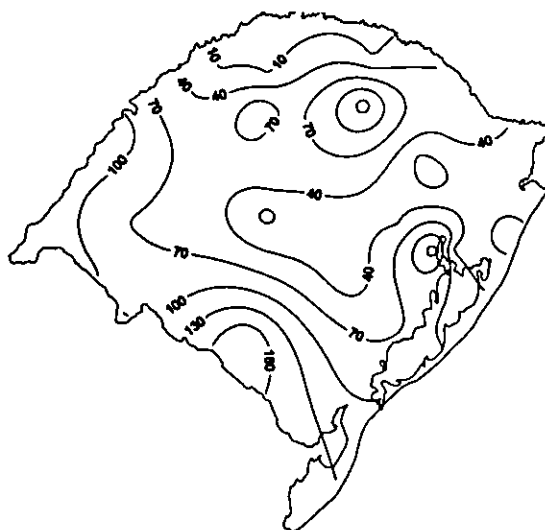
FIG. 1. Deficiências hídricas - balanço hídrico de Thornthwaite & Mather (1957), com 100 mm de capacidade de armazenamento de água disponível no solo - ocorridas no Rio Grande do Sul no período de setembro de 1982 a maio de 1983.

desenvolvimento das culturas de primavera-verão e grandes enchentes em todo o Estado no período de outono-inverno. O impacto econômico e social do fenômeno foi abordado por Berlatto (1992), o qual apontou que o forte episódio "El Niño" impossibilitou a colheita de mais de 1,6 milhão de toneladas de grãos, com impacto econômico na produção agrícola estadual de 278 milhões de dólares. Mesmo sendo este um ano de excedentes hídricos, deficiências hídricas de pequena expressão ocorreram no período de setembro a maio. As deficiências variaram entre 40 e 160 mm, com os maiores valores situados no sul do Estado (Fig. 1). Já no ano de 1985/86 ocorreu o fenômeno inverso. O Estado foi submetido a uma intensa estiagem, cujos valores de deficiência foram acima de 400 mm em grande parte do Rio Grande do Sul (Fig. 2). Este fenômeno determinou perdas da ordem de 4,4 milhões de toneladas de grãos e um prejuízo de 590 milhões de dólares (Berlatto, 1992). Os anos de 1982/83 e de 1985/86 foram, portanto, escolhidos para a continuidade da análise da relação entre as condições