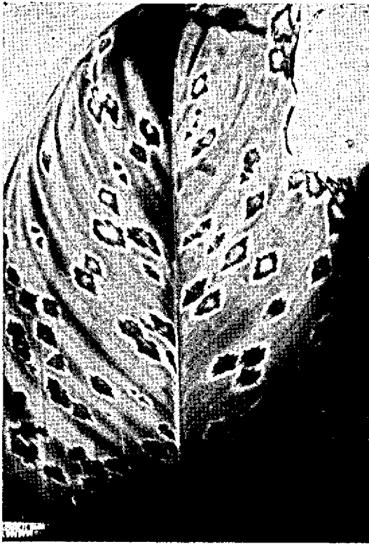
FIG. 1. Folha de Ischnosiphon simplex Hub. ( Guarumã-mirim ) exibindo manchas pardas, em forma de losango, provocadas pelo fungo Piricularia guarumeicolae .

Conídios (Fig. 2, c) piriformes de cor idêntica à dos conidióforos, com dois septos distintos, presos