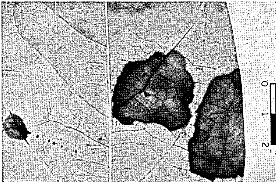
FIG. 3. Folha de Aniba burchellii Kostern (louro) exibindo manchas necróticas, circulares causadas pelo fungo Piricularia lourinae .

1.254 — Material herborizado no IPEAN — parasítico a folhas vivas de Aniba burchellii Kostern (família Lauraceae) conhecido pelo nome vulgar de louro, col. L. R. Duarte, Mocambo, área de reserva do IPEAN, Belém, Est. do Pará, Brasil, 9 de setembro de 1969, tipo.