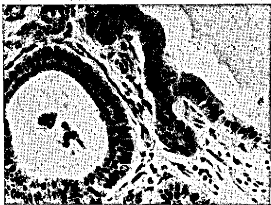
FIG. 3. A esquerda estrutura alveolar em que a parte apical das células epiteliais está preenchida por grânulos corados em vermelho, enquanto que as células epiteliais da estrutura alveolar à direita não apresentam esses grânulos (Bov. 122/65). SAP 16638. PAS. Obj. 10.

alvéolos está corada em vermelho. No caso do Bov. 122/65 (SAP 16638) há, ao lado de campos em que a parte apical das células epiteliais se apresenta preenchida por grânulos corados em vermelho, campos em que as células epiteliais não apresentam esses grânulos (Fig. 3 e 4). Da mesma maneira, a secreção dentro dos alvéolos em alguns campos está corada em róseo, em outros não se corou. Com o Alcian blue em dois diferentes pH (0,5 e 2,5), e também com Astrablau, essas secreções, na parte apical das células, tomaram uma tonalidade de cor azul brilhante, reações estas, porém, menos intensas que com o PAS (Fig. 5). No caso do Bov. 26/70, ao lado de campos em que as células epiteliais apresentam a parte apical corada em azul, da mesma maneira se corando a secreção nos alvéolos, há campos em que as células epiteliais não mostram coloração azul em sua parte apical, porém, a secreção nos alvéolos continua a se corar em azul. No caso do Bov. 122/65 o mesmo é observado, porém, em grau bem menor. A positividade ao método do PAS dos grânulos de secreção não foi abolida pela ação enzimática através da pepsina; nos dois casos de tumores o aspecto foi igual ao descrito na reação do PAS.