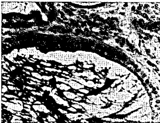
FIG. 5. Parte apical das células epiteliais de estrutura alveolar corada em azul brilhante (Bov. 26/70). SAP 19515-16. Alcian blue. Obj. 20.