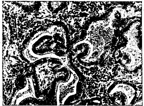
Fig. 2. Tumor etmoidal sob forma de adenocarcinoma; estruturas alveolares com projeções papilíferas para dentro de sua luz (Bov. 122/65). SAP 16638. H.-E. Obj. 10.

No tumor do Bov. 122/65 (SAP 16638), vê-se que ele é formado por estruturas alveolares, também muito irregulares em forma e tamanho, havendo ainda projeções papilíferas para dentro de sua luz (Fig. 2). Além dessas formações alveolares, há cadeias celulares e células tumorais isoladas. Há necroses e hemorragias extensas. O estroma varia muito em quantidade e aspecto. Em alguns campos é abundante, em outros é escasso. Em uns é formado principalmente por tecido conjuntivo colágeno, em outros é muito frouxo, mixomatoso; há nele número bastante variável de células de tamanhos e formas diferentes, algumas com aspecto de células epiteliais tumorais, outras com aspecto de fibroblastos e fibrocitos, além de células inflamatórias como células plasmocitárias. Há também trabéculas ósseas nesse estroma.