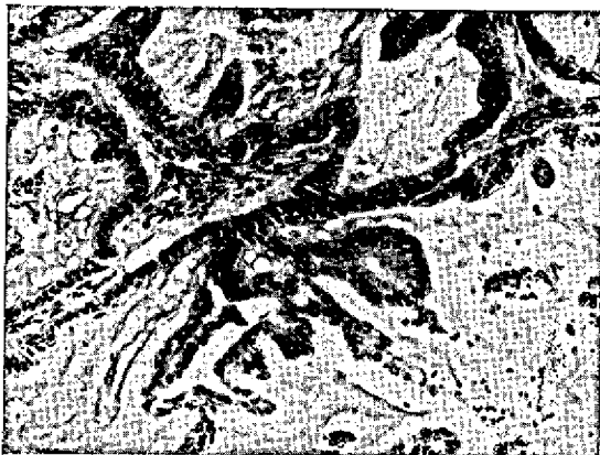
Fig. 1. Tumor etmoidal sob forma de adenocarcinoma; formações alveolares muito irregulares com projeções papilíferas (Bov. 26/70). SAP 19515-16. H.-E. Obj. 10.

As células epiteliais que revestem os alvéolos têm forma achatada, cúbica até cilíndrica, encontrando-se as formas achatadas mais nos alvéolos maiores. Há grande anaplasia entre as células epiteliais, variações grandes em tamanho celular, em tamanho do núcleo. Nas células epiteliais achatadas o núcleo também tem esta forma. Nas células de forma cúbica ou cilíndrica os núcleos estão na parte basal e são ovais no sentido transversal a re-