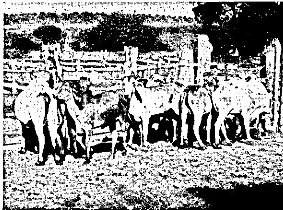
FIG. 1. Parte dos animais, afetados pela "cara inchada", transferidos de fazendas de ocorrência da doença à Fazenda T., município de Itiquira, MT, onde não ocorre "cara inchada", por ocasião do primeiro reexame em 10.10.74. A maioria dos animais apresenta mau estado de nutrição.