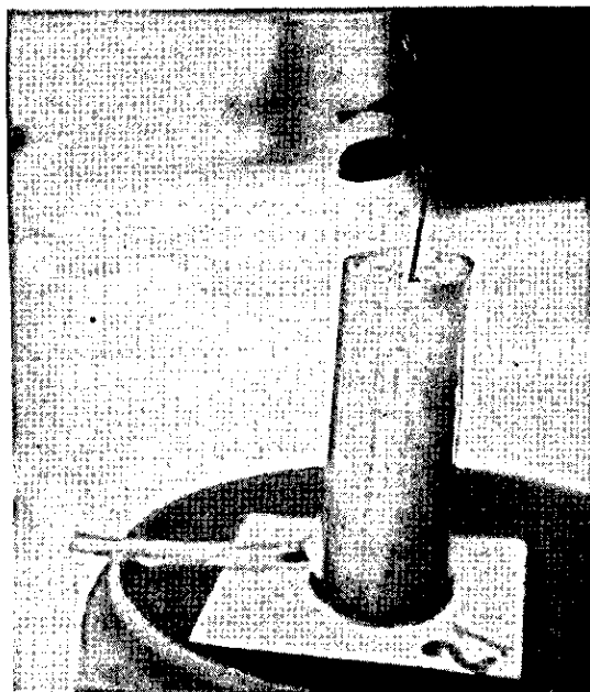
FIG. 1. Cilindro plástico usado para o plantio das mudas a serem inoculadas com Phytophthora citrophthora . Em detalhe, o tubo plástico usado na irrigação, drenagem, aplicação da solução de Hoagland's e inoculação.

Teve-se o cuidado de não promover o encharcamento da superfície do cilindro, evitando-se, assim, a ocorrência de doenças causadoras do apodrecimento da raiz. Cerca de 120 dias após o plantio, os sistemas radiculares das mudas foram inoculados com uma suspensão aquosa muito