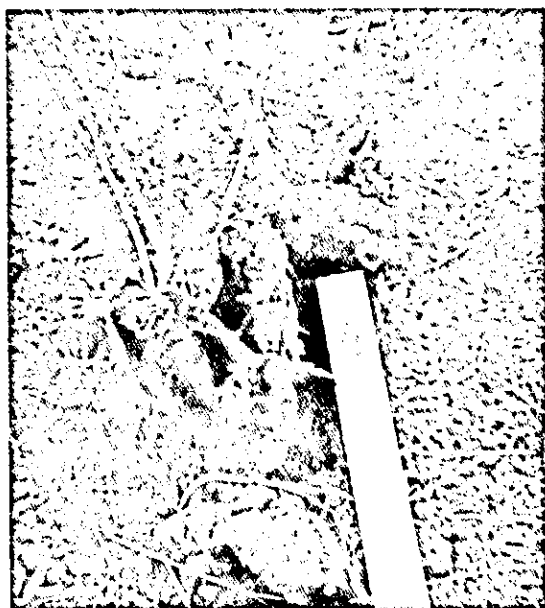
FIG. 3. Corte longitudinal de uma raiz da variedade Cedinha, material resistente à Podridão Radicular ( P. drechsleri Tucker)