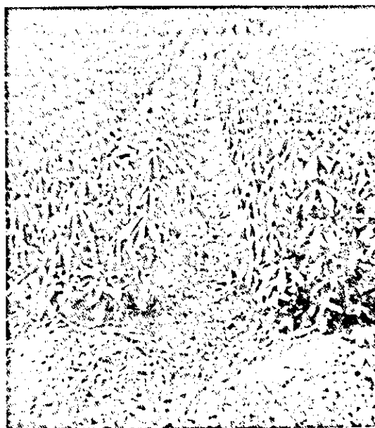
FIG. 4. Sistema de cultivo que deverá ser adotado visando ao controle da doença.