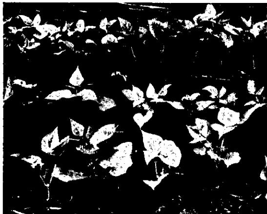
FIG. 2. Vista de campo da linhagem MIA-6 e população F 2 do cruzamento entre Nep-2 e MIA-6.

geração F 2 , oriunda de cruzamentos com a cultivar Nep-2, é apresentada na Fig. 2. Pela observação das linhas segregantes obtidas, notou-se não existir ligação entre o caráter altura basal longa e a orientação das folhas e ramos acima descritos. A linhagem MIA-6 possui alto potencial de produção, comparável ao da cultivar original, de onde ela foi selecionada, mas apresenta má distribuição das vagens, que se concentram na parte superior da planta, tornando-a vulnerável ao acamamento. É ainda suscetível à bacteriose comum, à antracnose, ao mosaico comum e ao mosaico dourado.