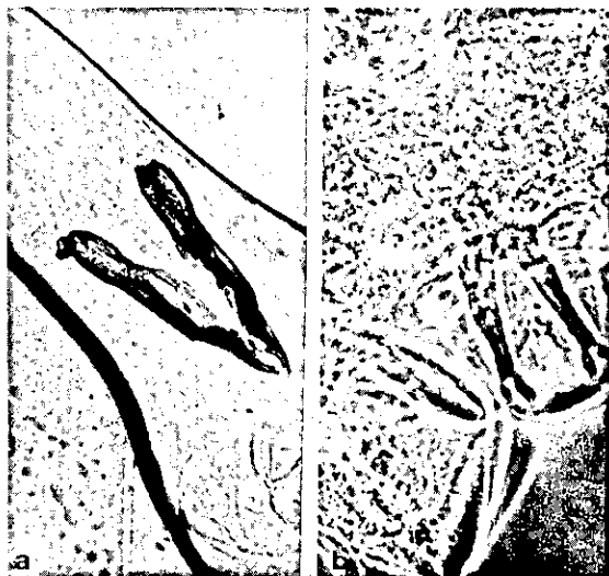
FIG. 3. Espículos (3a) e raio dorsal (3b) do macho de C. spatulata .