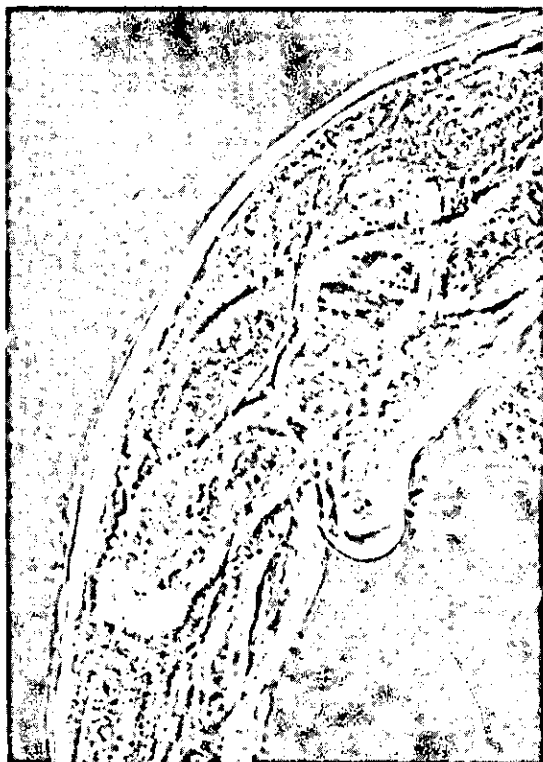
FIG. 4. Características morfológicas de C. spatulata Baylis, 1938. Região vulvar.