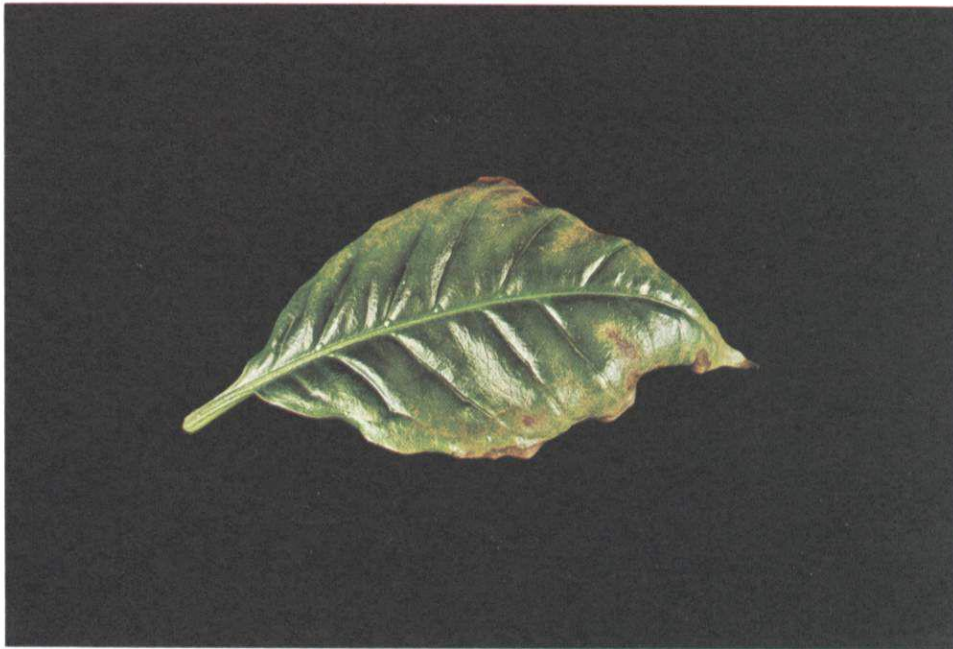
FIG. 3. Sintomas da toxidez de Al em folhas jovens de cafeeiros; folhas pequenas, apresentando clorose e alguns pontos necróticos ao longo da margem e com um aspecto de enrolamento.