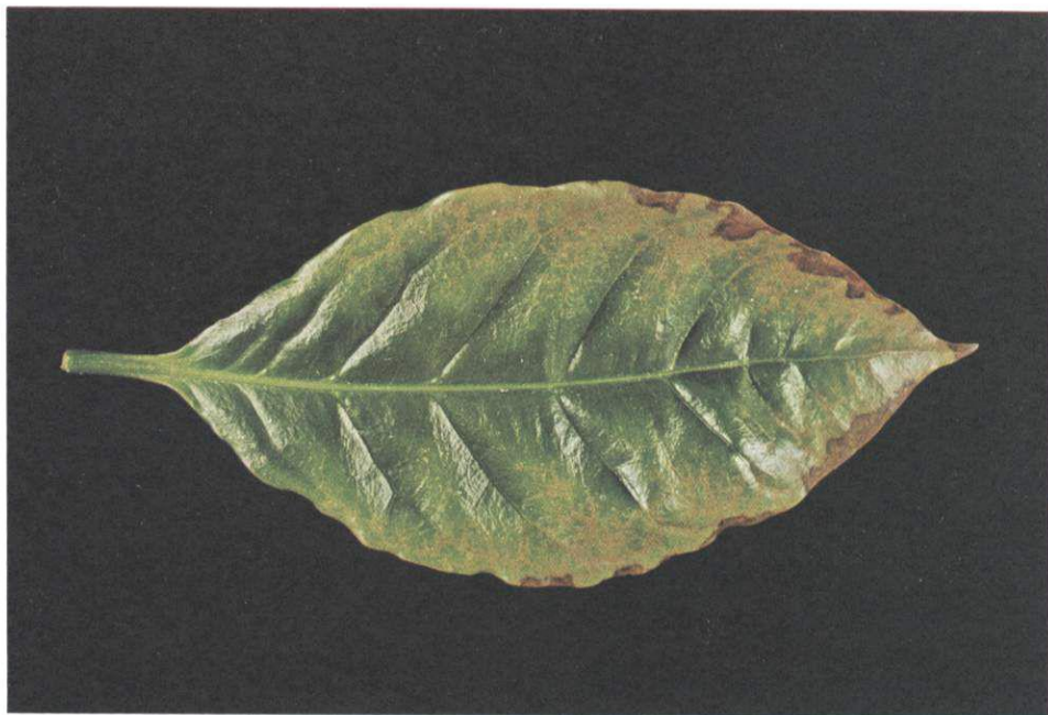
FIG. 4. Sintomas da toxidez de Al em folhas de cafeeiros localizada na parte média dos galhos produtivos; clorose e pontos necróticos iniciando na margem e progredindo para o interior do limbo da folha.