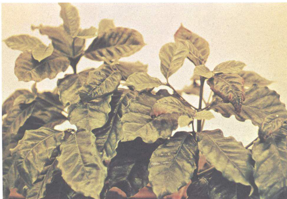
FIG. 2. Vista geral dos sintomas de toxidez de Al em mudas de cafeeiros em solução nutritiva.

Os sintomas visuais da toxidez de Al na parte aérea das plantas foram relacionados com as mudanças nas concentrações de outros constituintes minerais. A Fig. 2 mostra os efeitos de Al_t ( 0,296 \text{ mmol dm}^{-3} ) na solução nutritiva nos sintomas foliares em mudas de cafeeiros, amostradas dezoito meses após o início dos tratamentos. Em