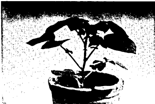
FIG. 2. Planta de batata obtida de cultura de meristema, 145 dias após o plantio em meio de cultura.