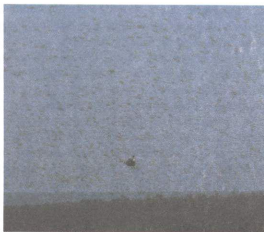
FIG. 4. Nuvem do Rhammatocerus schistocercoides sendo pulverizada por helicóptero.