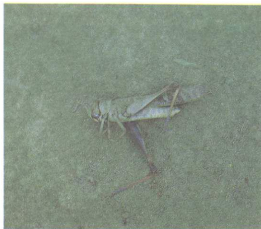
FIG. 1. O gafanhoto Rhammatocerus schistocercoides mostrando a coloração azul metálica nas coxas trazeiras.

Os gafanhotos que infestam o estado do Mato Grosso pertencem à espécie Rhammatocerus schistocercoides (Rehn, 1906) (Orthoptera:Acrididae, Gomphocerinae), que, quando adulto, apresenta as asas de coloração cinza clara com manchas de coloração cinza escura. O tórax e a cabeça podem apresentar coloração verde ou cinza clara. Existe uma forma fenotípica, que compõe 15% da população, que mostra uma mancha preta ocupando parte da cabeça e a parte lateral do protórax. As mandíbulas são de cor azul metálica, assim como a parte interna das coxas e a parte terminal das tíbias. O restante das tíbias é de coloração alaranjada (Fig. 1). Os machos da espécie medem de 35 a 40 mm de comprimento, e as fêmeas de 38 a 47 mm de comprimento. Os machos adultos pesam entre 0,98 g e 1,26 g e as fêmeas entre 1,47 g a 1,77 g (Tabela 1). As fêmeas adultas têm, em média,