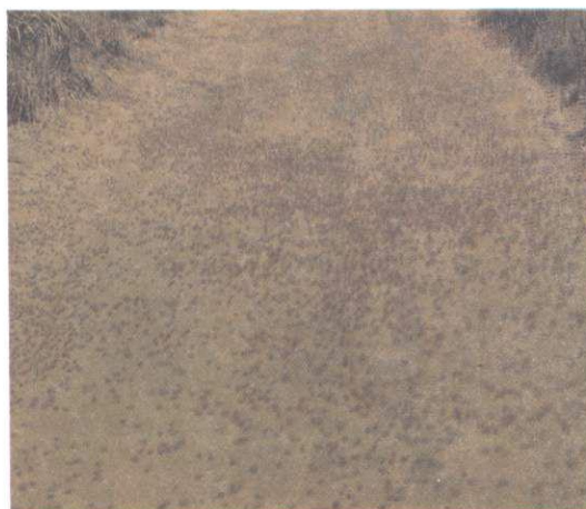
FIG. 3. Bando de saltões em 4º instar na reserva indígena Parecis.

Preferência alimentar – O R. schistocercoides prefere, em primeiro lugar, gramíneas nativas do cerrado e campo, seguindo-se as culturas de arroz, que são as mais visadas pela praga, que lhes causa grandes danos; em se-