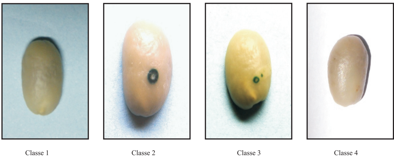
Figura 2. Classificação de sementes de cafeeiro pelo teste Lercafê. Classe 1, endosperma de coloração clara e embrião visível; classe 2, endosperma de coloração clara e lesão típica de ataque de broca, distante do embrião; classe 3, endosperma de coloração clara e lesão típica de ataque de broca, na região próxima ao embrião; classe 4, endosperma de coloração clara, sem embrião visível.

Outro resultado relevante é a presença de sementes brocadas, no tratamento testemunha (lote 1), visto que este, por análise visual, não as apresentava. Isso mostra ainda mais o potencial do teste Lercafê, pois ele foi capaz de detectar dano imperceptível a olho nu. Na Figura 3, é apresentada uma semente com dano