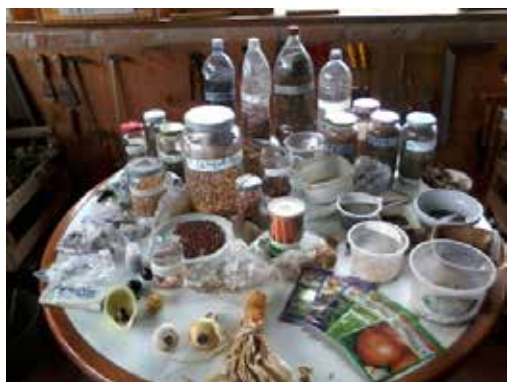
Figura 3. Banco Familiar de Sementes da AAT.

de hortaliças, leguminosas, árvores. Contudo, não havia, disponíveis na associação, recursos específicos para essa ação; foi aí que começaram a juntar as sementes, a colocá-las numa mesa e a trocar entre os associados. As Figuras 3 e 4, abaixo, mostram, respectivamente, o Banco Familiar de Sementes e o Banco Comunitário de Sementes da AAT.