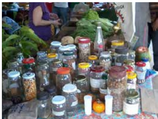
Figura 4. Banco Comunitário de Sementes da AAT.