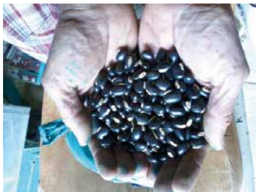
Figura 2. Mucuna-preta multiplicada desde a primeira distribuição de sementes.

No estado do Rio de Janeiro, o programa está sendo executado pela Superintendência Federal de Agricultura do estado (SFA-RJ), por meio da Divisão de Política, Produção e Desenvolvimento Agropecuário (DPDAG), em parceria com instituições como: CPOrgs; Embrapa Agrobiologia; Emater-RJ; Instituto Federal do Rio de Janeiro (IFRJ) (Campus Pinheiral); Articulação de Agroecologia do Rio de Janeiro (AARJ); Sebrae/RJ; Secretarias Municipais de Agricultura; associações; grupos de agricultores; Casa de Sementes Livres de Aldeia Velha; Cooperativa de Consultoria, Projetos e Serviços em Desenvolvimento Sustentável Ltda. (Cedro); Escola da Mata Atlântica; entre outros. A gestão do programa ficou sob responsabilidade da SFA-RJ juntamente com outras instituições, como a Embrapa Agrobiologia.